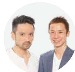
げんき~ず(吉本興業)