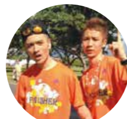
げんき~ず(吉本興業)