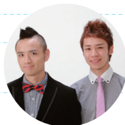
げんき~ず(吉本興業)