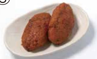
行田ゼリーフライ