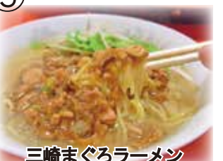
三崎まぐろラーメン