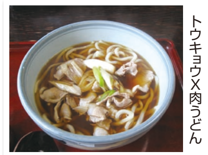
トウキョウX肉うどん